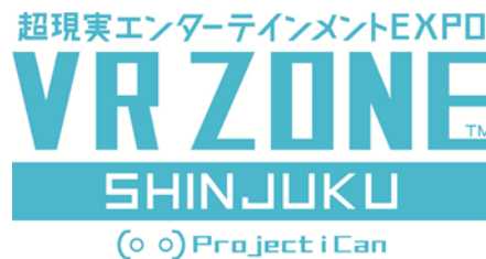
Das VR ZONE SHINJUKU Logo