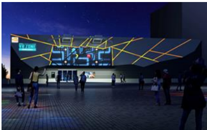
Esterno della struttura

VR ZONE SHINJUKU offrirà anche una serie di nuove esperienze in VR senza IP in cui gli ospiti potranno esplorare un mondo fantasy su una bicicletta alata o fuggire da un dinosauro e molto altro ancora. Ciascuna attività è concepita affinché gli ospiti possano immergersi completamente nell'esperienza in VR. Inoltre, potranno provare numerose attività senza VR, come sopravvivere a un'enorme palla in espansione imprigionati in una cella chiusa a chiave, acquistare souvenir originali o pranzare in un resort virtuale e vivere un intrattenimento a tutto tondo. Inoltre, BANDAI NAMCO Entertainment Inc. ha collaborato con il noto studio di grafica digitale NAKED allo sviluppo di proiezioni sulle pareti interne ed esterne del centro. Sulle pareti esterne, verranno proiettate diverse immagini come quelle del gioco PAC-MAN, mentre all'interno una mappa del Centro che fungerà da interfaccia della struttura con la quale gli ospiti potranno interagire semplicemente toccandola.