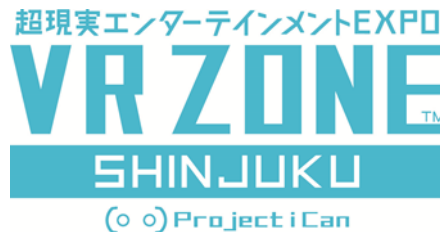
Logo VR ZONE SHINJUKU