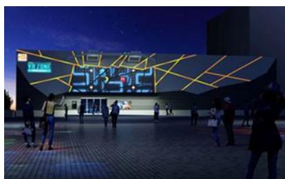
Image de l'extérieur du complexe

VR ZONE SHINJUKU comprendra également une vaste gamme d'activités en réalité virtuelle non lié à une franchise, où les joueurs pourront vivre des expériences uniques, comme explorer un monde fantastique sur un vélo ailé, survivre dans un univers horrifique plein de dinosaures, et bien d'autres choses. Chaque activité est conçue pour que les participants soient entièrement plongés dans l'expérience immersive qu'est la réalité virtuelle. Mais il y aura aussi toute une gamme d'activités non liées à la VR. Les visiteurs pourront essayer de sortir d'une cellule fermée renfermant un ballon géant se gonflant peu à peu, acheter des souvenirs originaux, ou encore profiter de plats et divertissements dans une zone de restauration virtuellement simulée pour que leur expérience soit tout à fait complète. En plus de tout ça, BANDAI NAMCO Entertainment Inc. a fait équipe avec le célèbre groupe d'art digital, NAKED, pour mettre en place des projections lumineuses à l'intérieur et à l'extérieur du complexe. A l'extérieur, les visiteurs retrouveront notamment une projection de PAC-MAN, tandis qu'à l'intérieur un "Arbre central" servira d'interface au complexe : d'une simple pression, les visiteurs pourront interagir avec le bâtiment même.