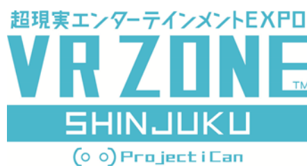
Logo VR ZONE SHINJUKU