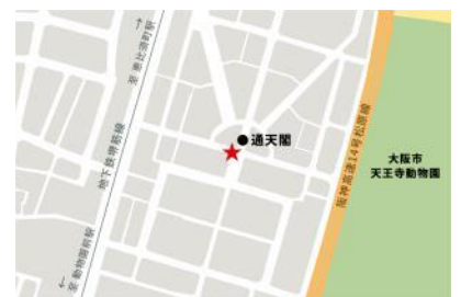
<乗車希望者集合場所>

※抽選へのご参加を希望される方は、「アソビモット project」公式サイト( http://asobi.bandainamcoent.co.jp/ )にてイベントの詳細を必ずご確認ください。