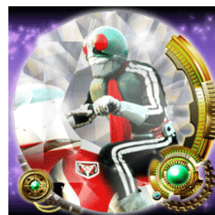
ブレイブジュエル