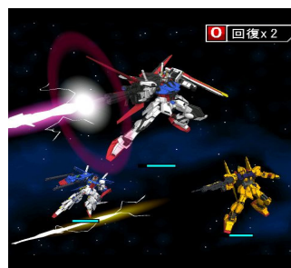
ゲーム画面イメージ