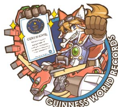
ギネス・ワールド・レコーズ 認定記念イラスト

株式会社バンダイナムコゲームスは 2010 年 10 月 28 日(木)に発売したニンテンドーDS 用ソフト「Solatorobo ソラトロボ それから CODA へ」の CM 放送手法において、「8 時間で異なる 100 通りの同一製品 CM を 100 本流した CM」としてギネス・ワールド・レコード社より認定を受けました。10 月 21 日(木)15 時から 23 時までの 8 時間の間にギネス世界記録に挑戦し、東京メトロポリタンテレビジョンで 100 パターンの CM を放送しました。ゲームに登場するキャラクターの紹介のほか、ゲームの世界観から構想まで多岐にわたる CM の内容が、「驚異的な種類と本数で世界一である」と正式に認められました。