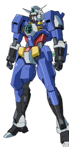
ガンダム AGE-1 スパロー