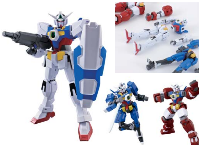
「GB(ゲイジングビルダー) 1/100 ガンダムAGE-1 ノーマル」

また、今回のガンダムの特徴である手・脚の換装システムを再現。別売りの強化パーツ「Gウェア」各種(各1,260円～・10月発売予定)や、今後発売されるGB(ゲイジングビルダー)シリーズの手・脚のパーツを組み換えることで、劇中のMSの換装再現はもちろん、オリジナルのMSをカスタマイズして作ることもできます。