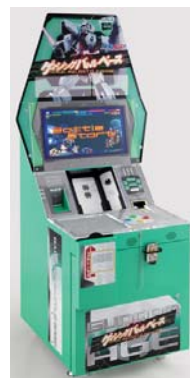
店頭無料ゲーム什器 『ゲイジングバトルベース』