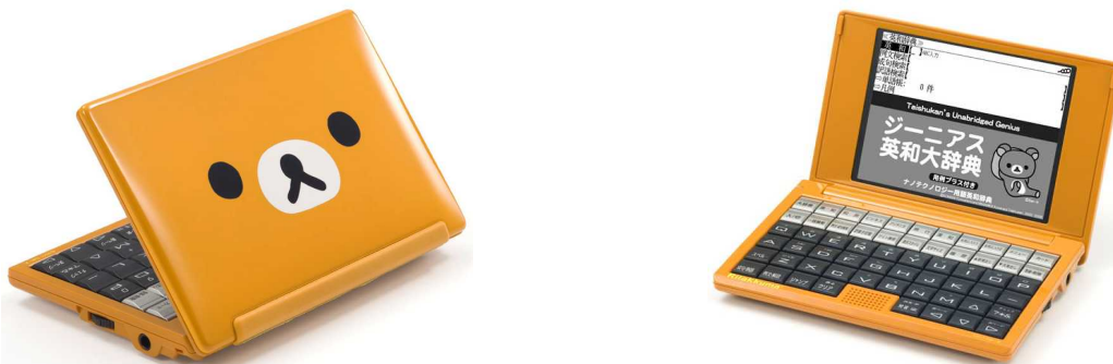
デザインイメージ

株式会社バンダイナムコゲームスは、お子さまから大人まで幅広い層に人気のキャラクター『リラックマ』をモチーフにしたオリジナル製品「リラックマ 電子辞書」を発売します。当社の運営するキャラクター製品通信販売サイト「LaLaBit Market(ララビットマーケット)」で2011年2月9日(水)12時から予約受注を開始します。