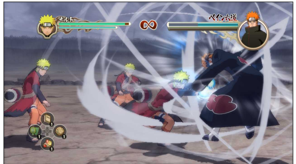
ゲーム画面(多彩な忍術を駆使したアクションバトル)

プレイヤーは、ドラマとバトルで構成される本作のメインモード「ナルティメットアドベンチャー」でアニメ「NARUTOーナルトー 疾風伝」の世界を追体験できるほか、個性溢れるキャラクターたちの中から好きなキャラクターを選択し、多彩な「忍術」や「奥義」を繰り出しながら、華麗で爽快なバトルを楽しむことができます。