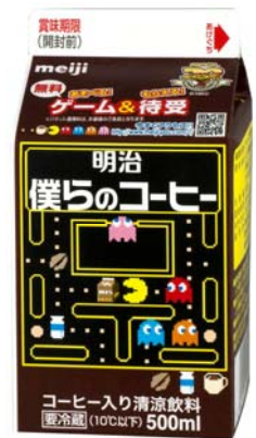
明治僕らのコーヒー (500ml/95円(税抜))