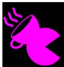
コラボレーションキャラクター

また、配信中のパックマン30周年記念ゲーム『PAC-MAN REBORN』(パックマンリボーン)にも期間限定で全7種のコラボレーションキャラクターが登場し、全種類のキャラクターをコンプリートすることでオリジナルの「称号」を獲得することができます。