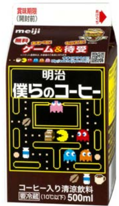
明治僕らのコーヒー (500ml/95円(税抜))