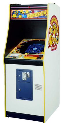
1980年に発売された「パックマン」アップライト筐体

「パックマン」はその後もワールドワイドでさまざまな形でシリーズ化され、アーケードゲームのほかに家庭用ゲーム機やモバイルゲームなどにも移植。生誕から30年間世界中で愛され続けています。