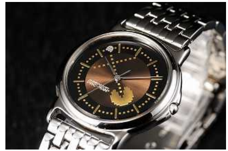
リミテッドウォッチ

プレスリリースの情報は、発表日現在のものです。発表後予告なしに内容が変更されることがあります。あらかじめご了承ください。画像は開発中のものです。