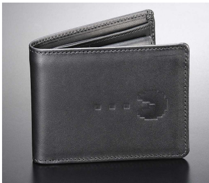
レザーウォレット

文字盤に「パックマン」を金色の特殊メッキ加工処理で施しました。「パックマン」が食べる“クッキー”(ドット)も細かく再現しています。また、ウラ蓋には30周年ロゴを、バックルにはチェリーをレーザー加工で刻印しています。