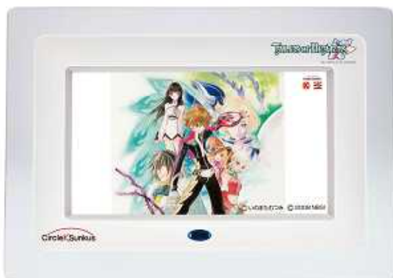
オリジナルフォトスタンド

TEL:0120-334-575 受付時間:平日10:00～17:00(ただし12月29日～1月2日は除く)