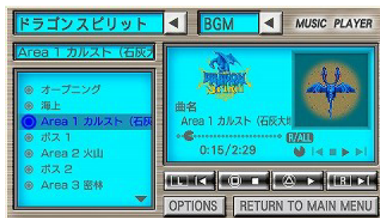
“ミュージックプレイヤー”機能 画面

今作に収録した13タイトルのゲームミュージックや効果音を、CD並の高音質で聴くことができる“ミュージックプレイヤー”機能を搭載しました。アーケード版開発時に作成したもののゲーム中で使用しなかった曲も収録しており、540種類以上のサウンドを聴くことができます。さらに、収録曲のプレイリスト編集やランダム再生、ループ再生等も設定可能で本格的なミュージックプレイヤーとして機能します。PSPの携帯性を生かして、いつでもどこでもゲームサウンドを楽しめます。