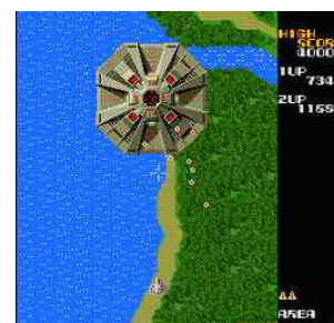
「ゼビウス」ゲーム画面