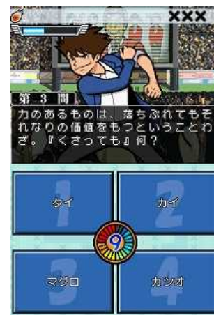
シングルモード画面

全世界最強クイズ王座決定ウルトラトーナメントで優勝を目指すモードです。“選択肢が減る”、“出題ジャンルを選べる”など、それぞれ異なる特殊能力を持つ4人の中から使用するキャラクターを選び、ジャングルや砂漠、宇宙などさまざまなステージを駆けめぐりクイズに答えていきます。対戦する相手は、ライバルたちだけではなく、「悪の組織」と呼ばれる謎の軍団から、くせのある刺客も登場します。ステージクリアに失敗すると、大会に敗退してゲームオーバーとなり、最初のステージからの再スタートとなります。