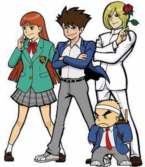
上段：マヤッペ・究児・プリンス 下段：チョコロピン

そして大歓声の中、始まったクイズトーナメント1次予選！だが、その歓声は1問目が終了した途端、悲鳴に変わった。恐ろしいワナが仕掛けられた大会！大会の裏で暗躍する悪の存在！果たして、究児たちは大会を無事に勝ち抜くことが出来るのだろうか！そして、究児と若ノ宮の勝負の行方は！優勝は誰の手に！？