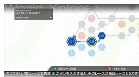
“ワールドエクスプローラー”画面

メインモードには、変化に富んだ30のコースによる230以上のレースが集まった世界“リッジユニバース”を、プレイヤー自らが自由なルートで開拓(エクスプローラー)できる“ワールドエクスプローラー”を新設しました。自分にあった難易度やスタイルにあわせてレースを選択し、攻略することが可能です。攻略ルートによってクラスが上のマシンや『リッジレーサー』のイメージキャラクター永瀬麗子からのメッセージなどのプライズを獲得することもできます。