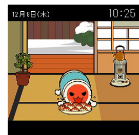
太鼓の達人おはなしドンドン

※「太鼓の達人 おはなしドンドン」に関する詳細は、NTTドコモ携帯サイト「太鼓道場」をご覧ください。