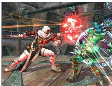
“ストーリー”モード