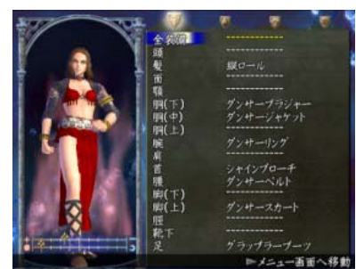
“キャラクタークリエーション”モード

髪型、目、服、アクセサリ、防具、武器など20カ所以上をカスタマイズし、“バトルアリーナ”モードや“ワールドコンペティション”などで使用するオリジナルの格闘キャラクターを作成することができます。パーツは、他のゲームモードで一定条件をクリアすると増えるほか、ゲーム中のファイトマネーを使いショップで購入することもできます。パーツを組み合わせ、ナムコのゲームキャラクターや実在する人物に似せて作るなどの楽しみ方もできます。