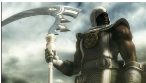
オープニングムービー

CPU を相手に、擬似的に世界ツアーに参戦できる“ワールドコンペティション”モードや、キャラクターごとの技を覚えたり自分のテクニックを磨くなどの練習ができる“プラクティス”モード、キャラクターによる演武やイベントシーンのリプレイ、開発時の設定イラストなどが閲覧できる“ミュージアム”モードも収録しました。