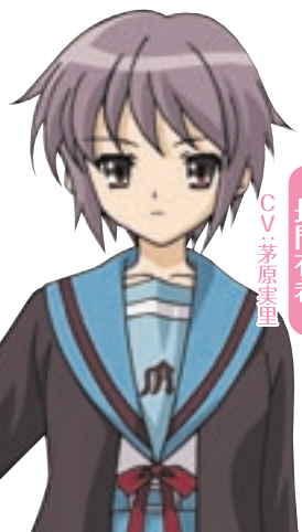
CV:茅原実里 長門有希