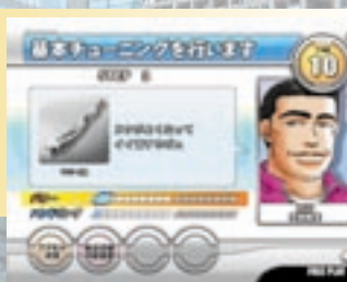
スピード重視でいくか、グリップ重視でいくか。プランに応じてチューンしよう。

ストーリーモードでライバルを倒すとチューニングポイントが溜まり、これが一定量に達するとチューニングできる。「パワー」と「ハンドリング」どちらかを選んでチューニングを進めよう。