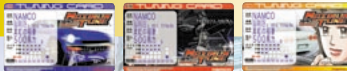
カードの絵柄は全3種類。どれが出るかは購入してのお楽しみ。

ゲームを始めたらチューニングカードを購入しよう。このカードにはチューニングでパワーアップしたマシンだけでなく、プレイヤー名やストーリーモードのクリア状況、タイムアタックのデータなども記録される。「マキシ」を楽しむための必須アイテムだ!