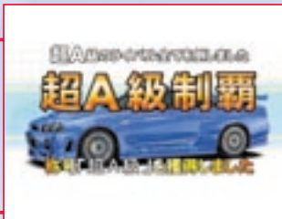
基本チューニング完了。2周目に挑め!

ライバルを次々と倒すことでマシンはどんどん速くなる。最終面の第20話までクリアすれば基本チューニングが完了。超A級の称号と共に600馬力だ。