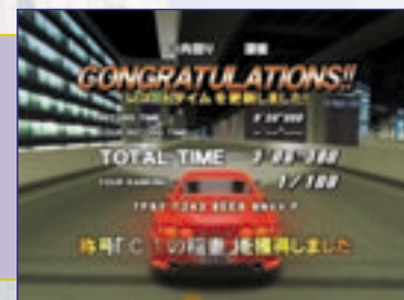
ストーリーモードを2周クリアすれば車種に応じた称号を獲得だ!

規定のコースを走ってタイムを競うタイムアタックモード。このモードでは各コースに設置されたチェックポイントのランプを発光させていくことで称号が獲得できる。