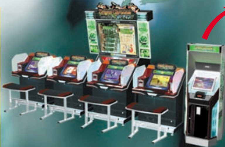
(エントリーステージ)

ドラゴンカードに加えて、新たにタイマーカードが導入された。これで、プレイヤーの対戦成績、称号といった情報がひとまとめに分かるようになったぞ。タイマーカードの購入、各種登録、ランキングやカードデータの閲覧等は新たに導入された「エントリーステージ」で行うのだ。それぞれドラゴンカードはタイマーカードに所有登録されるので、「他のプレイヤーの所有するドラゴンと融合しないと生まれないドラゴン」といった、新たな融合条件も発生するぞ!