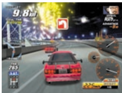
グラフィックは前作から大幅にパワーアップ。真夜中とはいえず、目を覚ませる鮮やかさだ。