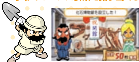
メダル獲得のチャンスが次々発生するぞ！