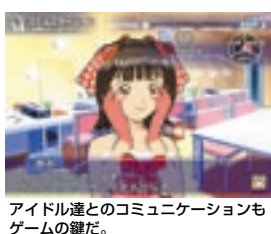
アイドル達とのコミュニケーションもゲームの鍵だ。