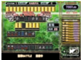
流局時のラストチャンスで幻の龍牌を引くと、「龍華 BATTLE」に突入！