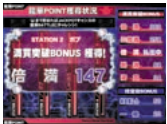
「満貫突破ボーナス」「指定役ボーナス」などがゲームを熱くする。