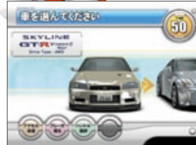
どのモードもまずは使用車種を選択からスタート。12台+αの車種が登場する。