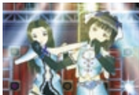
君の育てたアイドルが歌う！衣装や歌も君が決めるのだ。