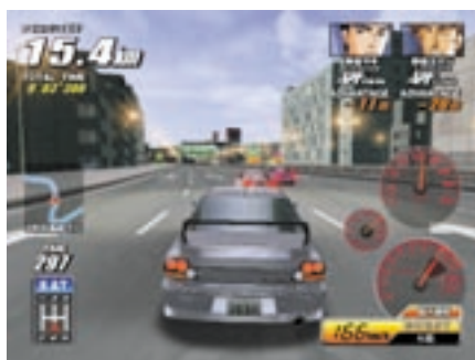
3つ巴のバトルも、もちろん健在。今回が初登場となる原作キャラクターにも注目！

© 2003 NAMCO LTD., ALL RIGHTS RESERVED All trademarks and copyrights associated with the manufacturers, cars, models, trade names, brands and visual images depicted in this game are the property of their respective owners. All rights reserved.