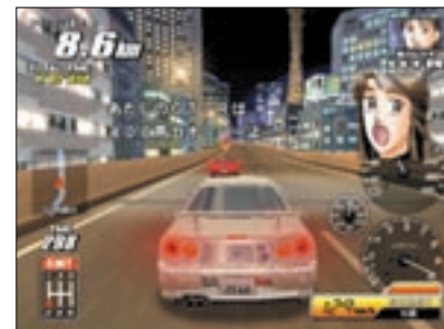
各ランクの最後に控えるライバルを倒せばプレイヤーの称号も変化する！