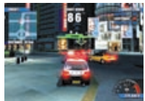
TOKYO COP and all related elements are property of Gaslco, SA © 2003

東京を舞台としたカーチェイスゲーム。プレイヤーは警察官としてパトカーに乗り、凶悪犯罪者の車を追跡し、逮捕するのが目的だ。「渋谷」「新宿」など実在の街を縦横無尽に走り回り、犯罪者の車に体当たりを食らわせる！ 反力付ステアリング搭載の可動筐体がリアルな操作感を演出するぞ。2台での通信プレイも可能だ（その際はどちらが早く犯人を捕まえるかを競い合う）。なお、IDとパスワードを使えば、筐体にプレイ内容を記録できる。