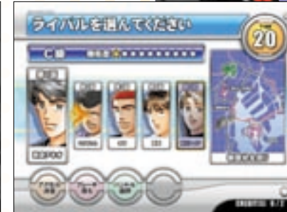
ストーリーモードでは、まずランクを選び、続いて対戦するライバルを指名する。