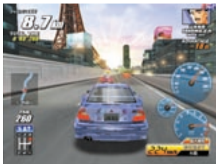
そして今作では早朝のステージも登場。まぶしい朝焼けの中でも最速への欲求は尽きない。