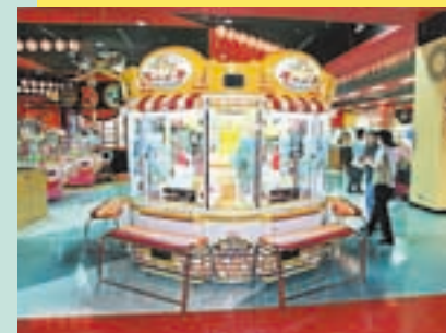
ゆったりとした空間で景品を楽しんで取ろう。「ピックスウィートランド」にチャレンジ！