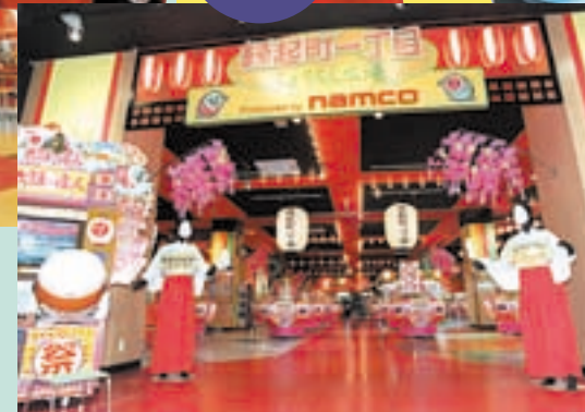
さあさ、ここがHAPPYのはじまり。