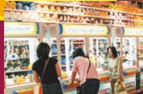
景品獲得GETに向けて、女性グループやファミリーの歓声が響く。