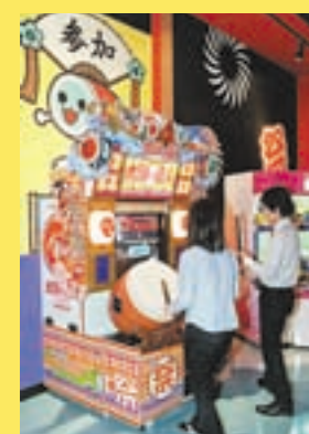
お祭り気分を満喫するには、やっぱり「太鼓の達人4」を、やるしかない！