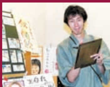
消防署には似顔絵やささんがいる