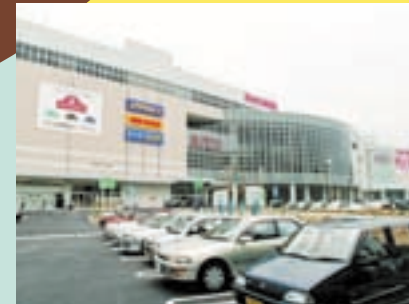
今、名古屋で一番の注目を浴びているイオン熱田ショッピングセンター・専門店街。