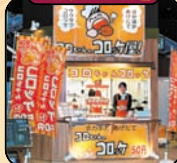
コロちゃんのコロッケ屋