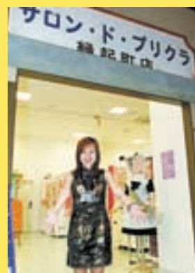
名古屋最大級のシールプリントコーナー。コスチュームは49種70着以上あり。