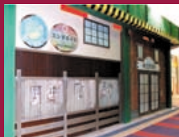
落書きや看板が懐かしい街並み