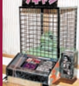
おお、こんな所にワギャンが・・・