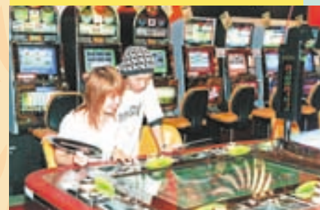
カップルで楽しめるメダルコーナー。