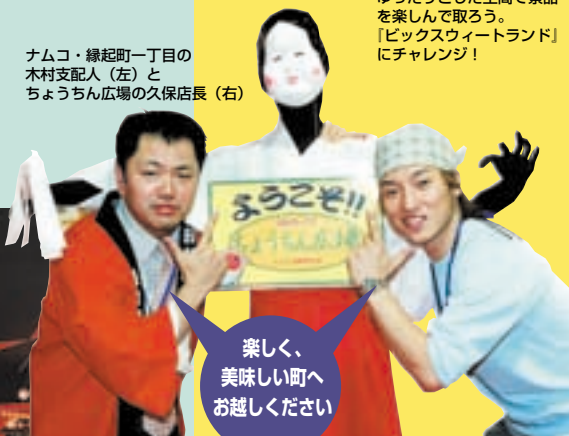
楽しく、美味しい町へお越しください