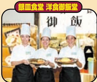
銀皿食堂 洋食御飯堂