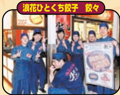
浪花ひとくち餃子 餃々