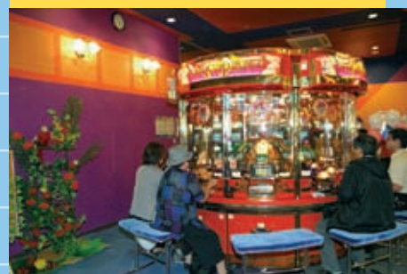
『ドラゴンパレス』の横にはオウムが見守る。