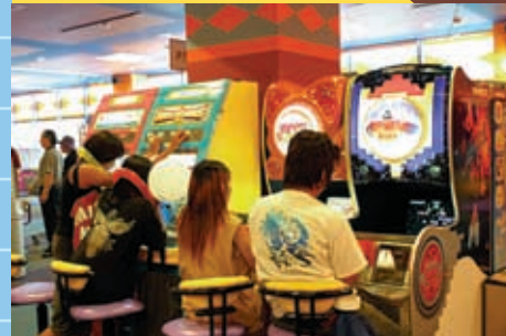
シューティングメダルシリーズに夢中。発射する感覚が新鮮！