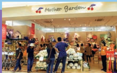
沖縄初出店。なごみ系雑貨の店「マザーガーデン」