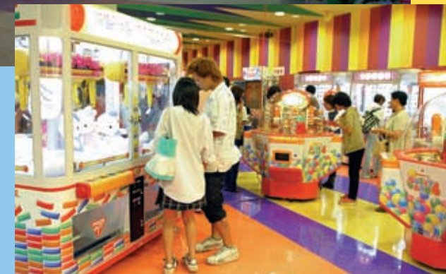
大型景品がGETできる『ワイワイクリッパー』。小物がたくさん取れる『スイートランド』。どちらにもハイビスカスがほどこされている。