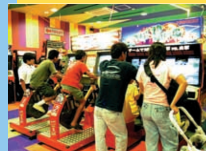
身体をダイナミックに動かす『ダウンヒルバイカーズ』。みんなで楽しむ『トーキョーウォーズ』。いずれもグループでワイワイ、歓声がある。

10月1日、那覇市にあり、開発がすすむ沖縄新都心地区おもろまちに、県最大級のショッピングセンター「那覇メインプレイス」がオープンした。9つのスクリーンを有するシネコンと70の専門店街。駐車場2400台を収容し、1日いても飽きない様々なショップがいっぱい！このメインプレイス2Fに「NAMCOLAND 那覇」も同時オープン。みんなが「でーじばんない」(すごくたくさん)に遊べるんサー。さあさ、ネーネもニニニ、オカアにオトゥ、オジもオバアもめんそーれ！