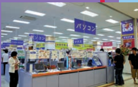
家電、携帯、パソコンなんでもござれ電器専門店「サンエー電器館 with DEODEO」