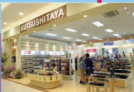
ここで生まれよう、くつした専門店。「靴下屋」