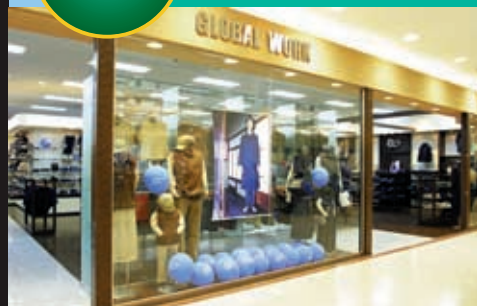
和+アジアでワジアン。ファミリーで着るワジアンカジュアルウェアを提唱する「グローバルワーク」。これからの季節は軽めの、はおりものと手作り風マフラーがおすすめ。