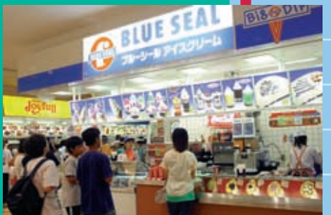
アイスクリームはブルーシール。パナラが根強い人気！他にもクレープやソフト、かき氷が食べられる「ピクディップ」