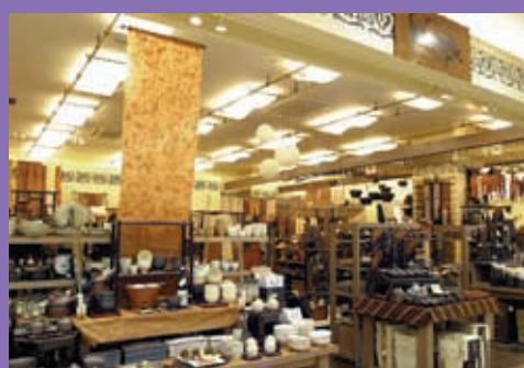
アジア各国のインテリア、衣服、雑貨を直輸入。ナチュラルなライフスタイルを提案する「ザ・セノゾイック」