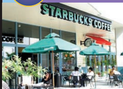
沖縄県下3番目となる「スターバックスカフェ」