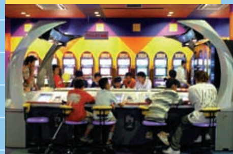
沖縄キッズはメダル大好き！