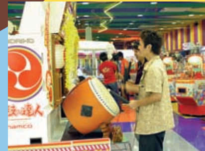
いつも大人気、『太鼓の達人3』を楽しむカップル。