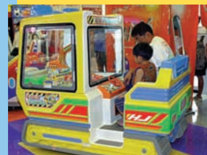
ショベルカーでお菓子もすぐえる乗り物『とれとれ！けんせつしゃ』。パパと一緒にちゅぱりよー！