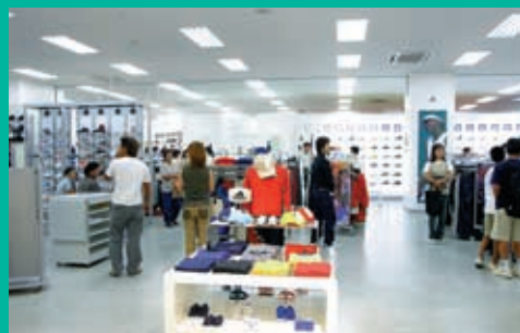
ナイキとアディダスの複合スポーツショップ。県内最大級の売り場面積を誇る「ブリンドースポーツ」