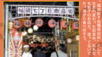
「福袋餃子自慢商店街」として生まれ変わった街並み。右も左も餃子のお店だ。迷っていないで片っ端から食べたい。

7月19日、ご当地餃子対決のフードテーマパーク「池袋餃子スタジアム」福袋餃子自慢商店街が堂々オープンした。本格大陸餃子から日本各地のご当地餃子まで、味自慢、アイデア自慢の餃子専門店が腕を競う「餃子のワンダーランド」だ。 餃子が日本人の暮らしに定着したのは、戦後、大陸からの引き揚げ者たちが本場の味を持ち帰ったから。日本各地で餃子文化が華開き、それぞれ独自の進化を遂げてきた。ちなみに中国で餃子といえば「水餃子」と「蒸し餃子」をさす。しかもオカズではなく主食としてたくさん食べる。主食としてたくさん食べるという点では宇都宮も負けてはいない。この度、この日本一の餃子消費都市「宇都宮市」と「ナムコ・ナンジャタウン」が餃子文化の発展と話題の創生を共通の目的に、「餃子姉妹都市」として手を結んだ。池袋が餃子のメッカになる日も遠くないだろう。 家族もカップルも、池袋餃子スタジアムでめぐる餃子三昧の一日を過ごしてね。謝謝！