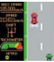
画像は開発中のものです。