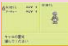
「大人になりたい15歳」 フリオ=スヴェーン CV: 宮沼久義

「なりきり」という要素を搭載し、シリーズの新たな可能性を展開したゲームボーイ用ソフト『テイルズオブファンタジアなりきりダンジョン』その第二弾がゲームボーイアドバンスで登場！『ファンタジア』『デスティニー』『エターニア』全てのテイルズシリーズにつながる世界で、二人の若者フリオとキャラロの冒険が始まる！戦闘シーンは、シリーズお馴染みのリニアモーションバトルを採用。「なりきり」システムもコスチュームが増え、さらに多彩になった。魅力的なキャラクターたちとこの世界を冒険しながら、キミは全てのコスチュームを集めることができるか！？