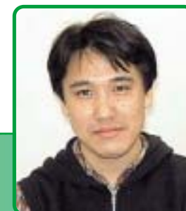
クロノアワークスグラフィックススーパーバイザー