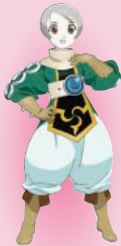
「夢見る15歳」 キャラロ=オランジェ CV: 有島モユ