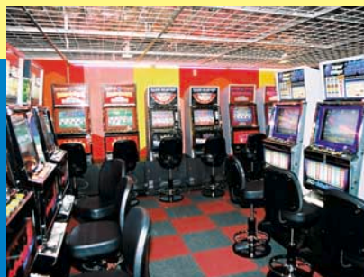
シングルメダルも充実。