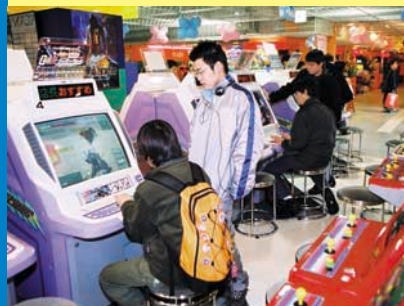
男子の視線が熱いビデオゲームコーナー。