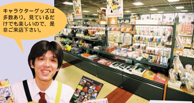
キャラクターグッズは多数あり。見ているだけでも楽しいので、是非ご来店下さい。

コミックス、CD、DVD、TVゲームやオリジナルグッズなど、充実の品揃えで北海道に初登場のキャラクターエンターテインメントショップ。 (TEL 011-223-2177 営業時間 10:00 ~ 20:00)