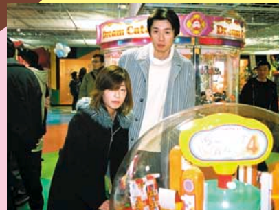
『スイートランド』に夢中になるナイスカップル。

ナムコ・ワンダーパーク札幌 北海道札幌市中央区北5条西2丁目エスタ9階 ☎011-242-0765 営業時間 10:00 ~ 22:30 (年中無休)