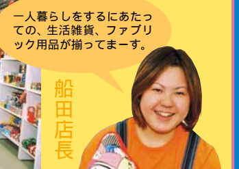
一人暮らしをするにあたっての、生活雑貨、ファブリック用品が揃ってまーす。