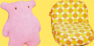
人気商品低発泡抱きぬいぐるみBOOB 2,900円