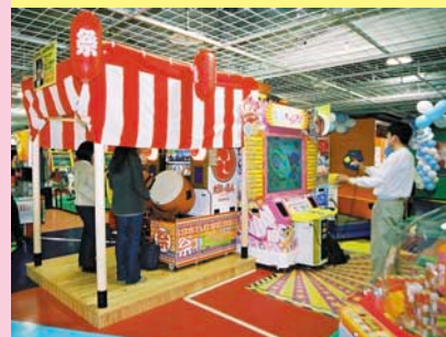
『太鼓の達人』はステージあり。もう叩くしかない！