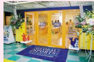
ハンドテックでリンパを もみほぐします。