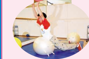
骨格と調整し、姿勢や歩き方が改善できる。10分1000円が基本料金のタイムマッサージ。

肩・腰・足へのタイムマッサージやリンパ系マッサージが受けられる「てもみん」。ボールを使って楽しく運動する「ファインフィックス」。美肌作りのリンパエステ「手のひら美顔」。健康食品が購入できる「グローバルスタイル」とマルチに楽しめるショップ。 (TEL 011-222-5688 営業時間 11:00 ~ 21:00)