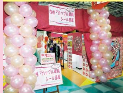
衣装は無料貸し出し。女性・カップル専用コーナーだから、いろいろ着替えて楽しんじゃおう。