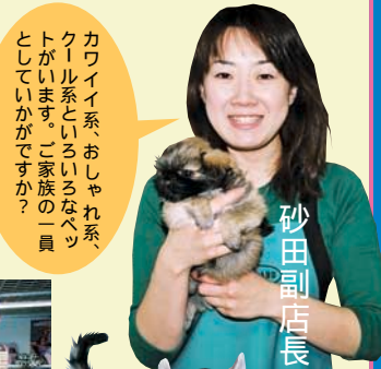
カワイイ系おしやれ系、クール系といるいるなペットとがいます。ご家族の一員としていかがですか？