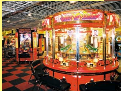
メダルコーナー。メダル機器は約100台、150名が同時にプレイできる。