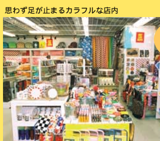
思わず足が止まるカラフルな店内

あなたのお部屋を彩り、コーディネートは自由自在。見る楽しさ、発見する感動がいっぱい。生活雑貨、インテリア雑貨の専門店。 (TEL 011-207-5105 営業時間 10:00 ~ 21:00)