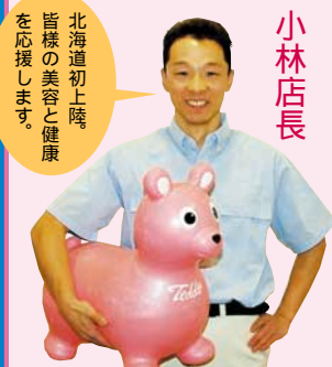
北海道初上陸 を応援します。