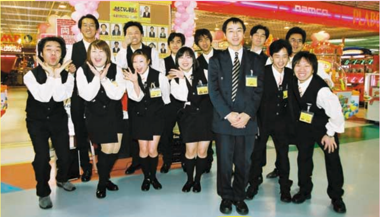
おもてなし軍団が皆様を迎えます。