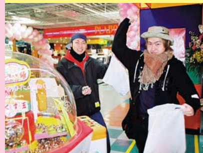
景品ゲット！思わずほころぶ笑顔の二人。