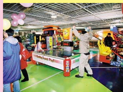
「ヤッター」と思わずでるガッツポーズ。