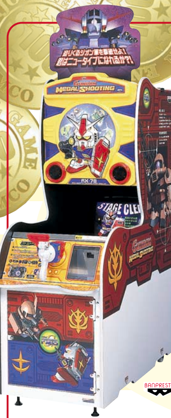
© 創通エージェンシー・サンライズ © BANDAI 2002 © BANPRESTO 2002 © 2002 NAMCO LTD., ALL RIGHTS RESERVED