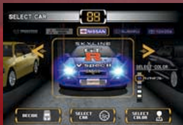
ボディカラーは実際のカatalogに存在する色が用意されている。

コインを投入したら、まずは車種を選択する。車は国産のターボカー12種類から選択可能。続いてボディカラー、ミッションを選択。そして、最後にナンバープレートにネームを登録すれば準備完了だ。