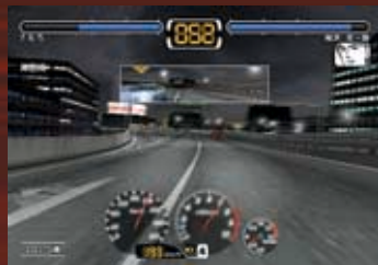
接戦時はライフゲージが減らない。ライバルの後ろに位置し、タイムオーバー直前に一気に抜くもテクだ!