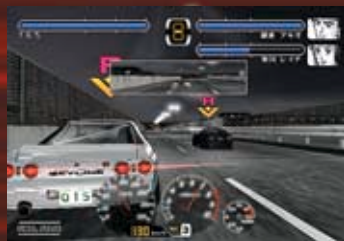
ステージは全部で8ステージ、中には3つ巴のバトルなどもある。キミは「悪魔のZ」に勝つことができるか!?