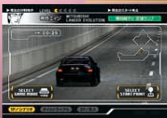
実時間で1分経過することにゲーム中の時間は1時間が経過する。