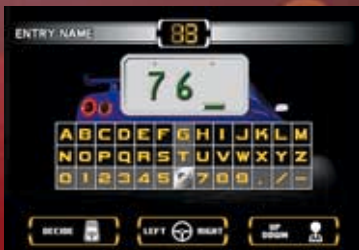
ナンバープレートへのネーム登録は、ハンドルとシフトを使って簡単に入力できる。