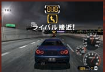
ライバルカーを発見したところからバトルが始まる。

ゲームはまずフリー走行からスタートする。ライバルカーを発見したらバトル開始!バトルは画面上部に表示されているライフゲージで決定する。車間距離が離れると後ろの車のライフゲージが減ってゆき、ゼロになった時点でゲームオーバーだ。また、制限時間内に勝負がつかない場合は、ライフに関係なく前にいる方が勝利となるのだ。