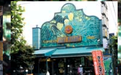
人気バンド「GLAY」のメンバーが通った 地元のハンバーガー屋「ラッキービエロ」