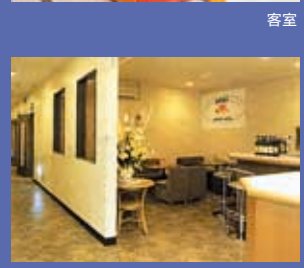
カラオケパーク「イタリアントマト」