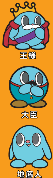
王様 大臣 地底人

1999年に確認された、地球における人類以外の知的生命体。高度な文明を地底に築いている。詳細は現在、調査団が組織され研究が進められているが、現在解っている限りの情報によると、その生態・生物学的な位置付けは地上に生息する既知の生物のどれにも属さず、まさに人類史上最大の発見との事である。王様、大臣といった、階級による区分があることは確認されているが、「名前」といったような個々の地底人を識別する方法が存在するのかわかっていない。お菓子作りが大好きで、かなりのうっかり者。