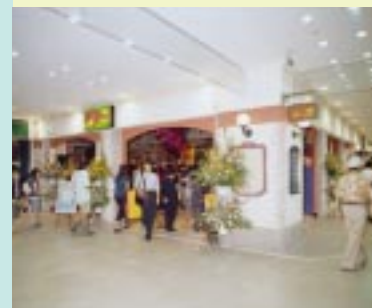
入口はニューヨークをイメージしたオシャレなデザインで、気軽に入りやすい。