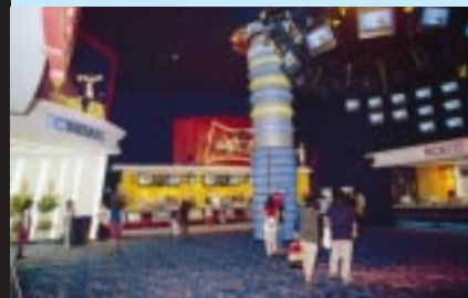
「ワーナー・マイカル・シネマス みなとみらい」は、8つのシアターがあるマルチプレックス。ポップコーン片手に映画をハシゴするのも楽しい。(横浜ワールドポーターズ5階)