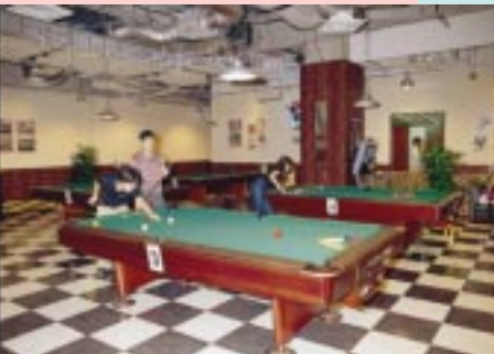
ビリヤードコーナーは10台設置。30分単位でプレイできるから、ビギナーでも気軽に楽しめる。

ドリームフィエスタ 神奈川県横浜市中区新港町11 横浜ワールドポーターズ5階 ☎045-222-2567 10時～23時