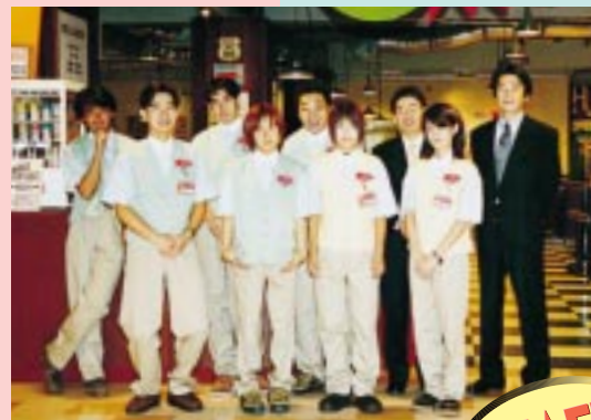
陽気なスタッフ一同。わからないことがあったら気軽に声をかけてね。