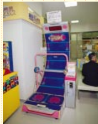
『ジャンピンググルーヴ』は、特別なスイッチを取り付けたことで、車椅子の方も座ったままプレイできます。

ナムコ横浜ハッスル 横浜ワールドポーターズ6階「ニューライフマート」内 ☎03-3756-8588 (ナムコ・福祉機器事業プロジェクト) 10時～19時