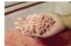
人気商品のひとつ「ちいさいひと」(1人¥30)。何に使うかはアナタ次第...!?