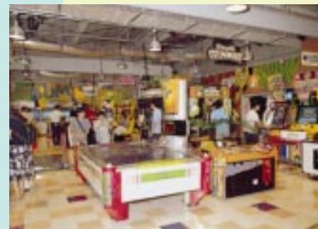
アーケードコーナーは体感ゲームやプライズゲームを約100台設置。みんなでワイワイ楽しんでね。