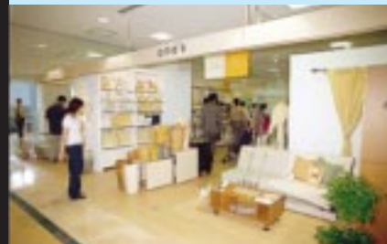
潤いある生活はインテリアから。「one's」では、小物入れなどを中心に、オシャレな生活雑貨を多数取り揃えています。(横浜ワールドポーターズ4階)