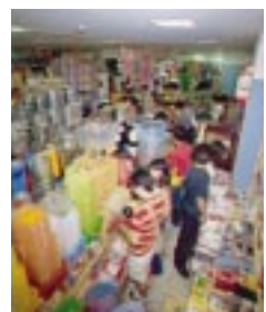
店内にはキャラクターグッズ、雑貨などが所狭しと陳列してある。その数、1万アイテム以上！

「発見」がある本屋さん ヴィレッジヴァンガード 「ヴィレッジヴァンガード」は、下北沢をはじめ約50店舗を構える本屋さん。とはいえ、店内には本他にキャラクターグッズや雑貨、インポートグッズ、果てはなにを使うのか? な物までが所狭しと陳列されており、思わず「ここは何の店!」と考えるしまうほど。初めてお店に入ると数多くの商品に圧倒されてしまうかもしれない。しかし、そのアイテムの多さこそがそのお店の魅力。ジャンク物探検の気分ですぐ店内を歩くのが本屋さんとはまったく違う面白さがある。