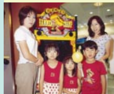
『ハンマーチャンプ』で遊んでいた仲良しファミリー。「ここには買い物途中に立ち寄りました！」