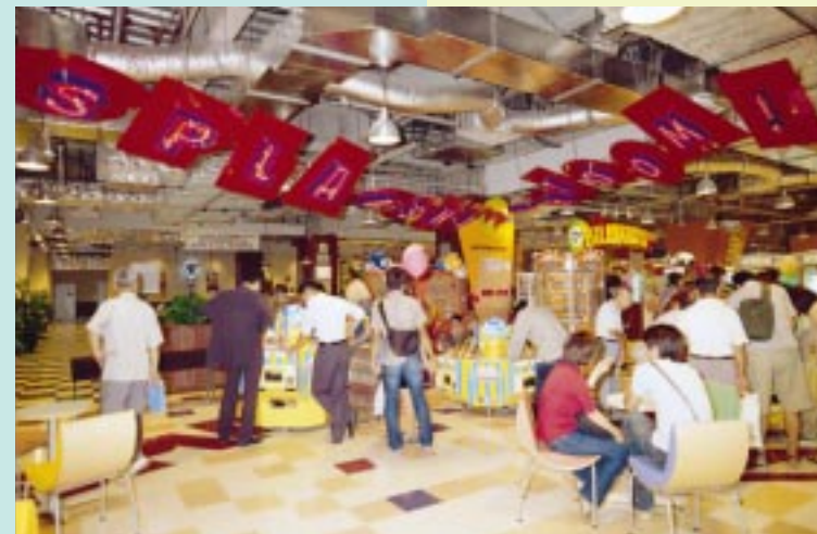
もちろんレストスペースも広いから、ちょっと一休みという利用もOK。