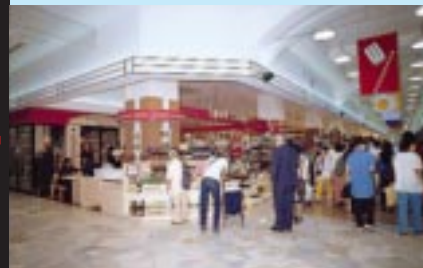
世界の珍しいお酒がそろっている「スパークエクステンジ」。その数はワイン、ビール併せて約2500種！また、量り売りもあるので、好みの味を好みの分量で購入できます。(横浜ワールドポーターズ1階)