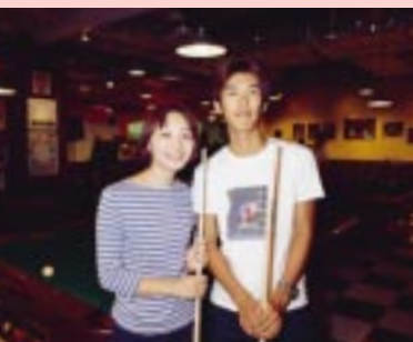
ビリヤードを仲良くプレイ中のお二人。「今日、初めて来ました。ゆっくり遊んでいきまーす」