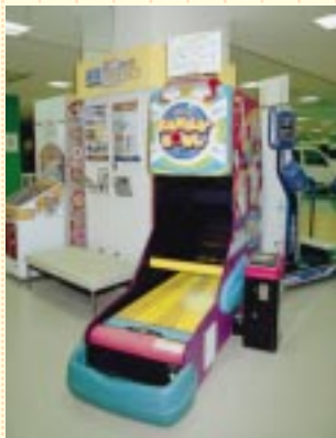
左右どちら側からもアプローチできる『ファミリーボウル』。ガーターも出にくくしてあるので、コントロールが苦手な方でも楽しめます。