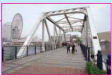
自動車 電車 「横浜ワールドポーターズ」に行く時は、JR・東急東横線・市営地下鉄桜木町駅から「汽船道」を歩いていこう。この橋は鉄道路線跡を整備した遊歩道で、みなとみらいの景観を楽しみながら散策できます。