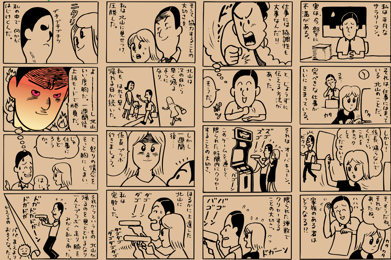
作 いりたまご コゲ照