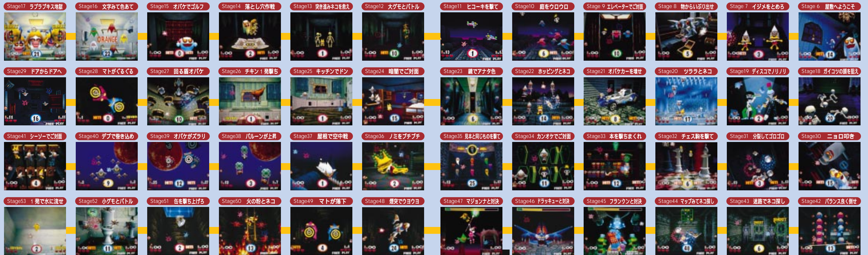
ステージは番号順に出るとは限りません。