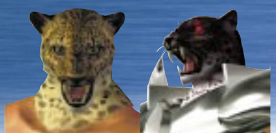
キング & アーマーキング

初代キングのライバルであり、キング2世のトレーナーでもあるアーマーキングが遂に復活! キング2世と共に、世代を越えた友情パワーで戦え。