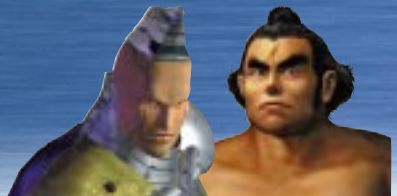
ガンジャック & 巖竜

鉄拳シリーズの屈指のパワーファイター2人がタッグを結成したら・・・相手に考える隙を与える前に超破壊力でKOしてしまえ！