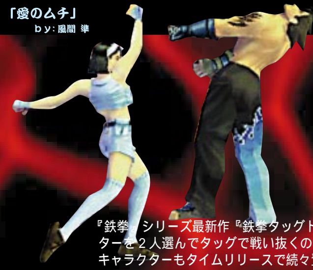
「愛のムチ」 by: 風間 準