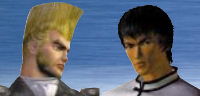
ポールフェニックス & フォレスト・ロウ

マーシャルアーツの使い手フォレスト・ロウと宇宙一の格闘家(を目指す)ポール。2人とも多彩な技を持っているため、様々なタッグコンボが組み立てられるだろう。