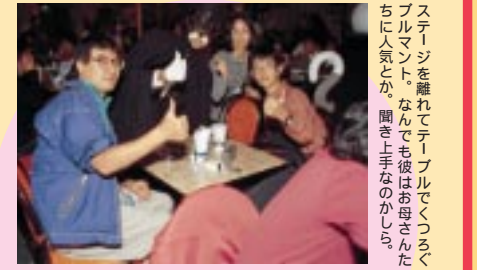
ステージを離れてテーブルでくつろぐブルマント。なんでも彼はお母さんたちに人気とか、聞き上手なのかしら。