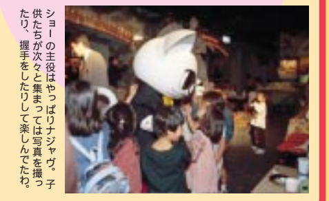
ショーの主役はやっぱりナジャヴ。子供たちが次々と集まるとは写真も撮ったり、握手をしたりして楽しんでたわ。