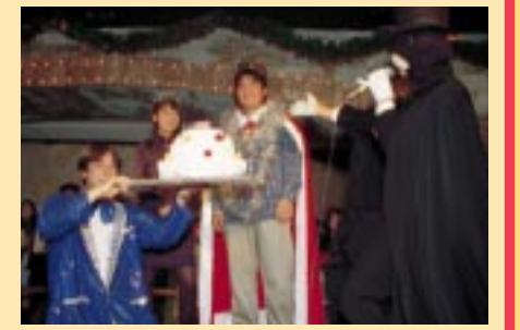
ブルマントの軽快な司会で進められる「パースターパーティー」。この日祝福された彼も「今まで生きて中で一番嬉しい」と喜んでくれたわ。