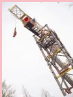
見ている方もハラハラドキドキの『パンジージャンプ』。