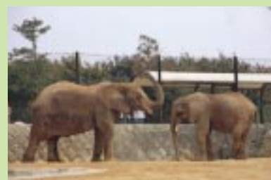
日本国内で3番目に生まれた子ゾウ(左)。まだママのそばが恋しいみたい。