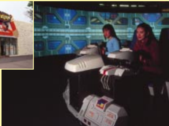
視界いっぱい広がる迫力のフルCG映像に、思わず手に汗握ってしまう(1プレイ500円)