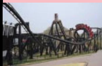
急降下、大回転と、容赦ない絶叫責めがあなたを襲う『ディアブロ』。