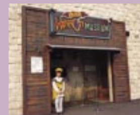
入口のスタッフの笑顔とは裏腹に、中では肝を抜く恐怖体験が待っている。

ここは街外れの古びた博物館。突然の停電で、プレイヤー扮する電気工事が、ペンライト片手に館内を点検することになった。館内で待ち受けるコワイ仕掛けの数々に、あなたは任務を全うすることができるか!?(1プレイ500円)