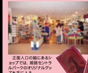
正面入口の脇にあるショップでは、姫路セントラルパークのオリジナルグッズも手に入る。