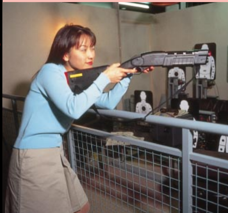
隊員に渡される専用ガンは、接近戦主力武器「AT-42タイプ-117ショットガン」。操作方法といい、重量感といい、本物のガンにひけをとらない迫力だ。

平和で豊かな「ラムカーナシティ」を度重なる犯罪行為から守るため、国家は城内警護特殊部隊『キャッスルガーディアン』を設立。キミはこの隊員の一人となって、専用ガン装備しシューティング訓練に励むのだ。最後にプレイヤーを待ち受けるものは...。(1プレイ600円)