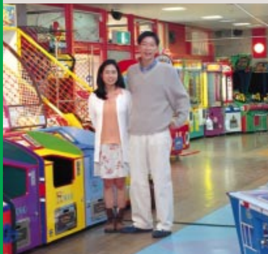
大阪から遊びに来たカップルをキャッチ! 嬉けるぜ

最新の体感スポーツゲームや、グループ、カップルで楽しめるアーケードゲームを豊富にラインナップ。館内も明るく開放的なのがイイね。(1プレイ100円～500円)