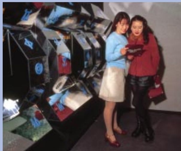
6週間後の未来を占う「666の鏡」や、心のバランスをはかる「エゴースオルガン」など、館内には不思議空間が広がっている。

入り口で手渡されるドクロを持ってプレイ開始。質問に答えるに従って、あなたの本当の姿がドクロにインプットされていく。