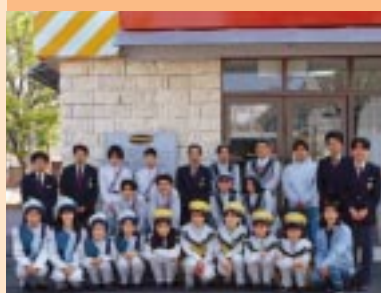
キミをナムコワールドへと誘う元気いっぱいのスタッフたち。プレザー姿で中央に立つのが館店長。