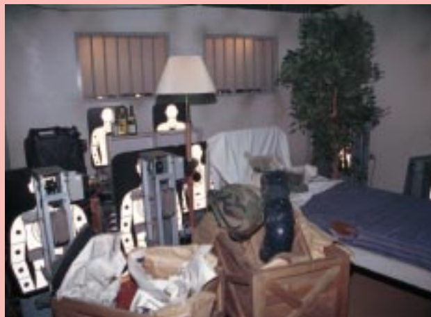
ここはモデルルームエリア。標的めがけて素早く発射!