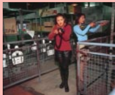
ブリーフィングを終えると、いくつかのステージにゾーニング。ここはウェア(倉庫)エリア。