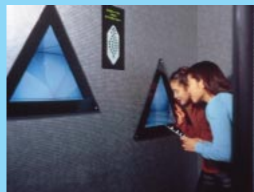
自分の心の迷いを象徴するかのよう、ミラーの迷路を手探りで進んでいく。

幻想的なミラーの迷路を進みながら各部屋で質問に答えていくと、現在のあなたの心理状態が明らかになる。最後の部屋「ココロの診察室」でミラーナの診断を受け、心理分析の結果が記された「ココロのカルテ」を授かる。(1プレイ500円)