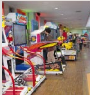
最新マシンを前に、友達、カップル、ファミリーで大いに盛り上がる