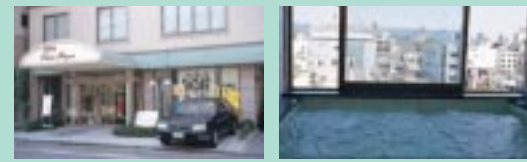
フランスのプチホテルをイメージしたという、かわいらしい外観が印象的。 ビルの谷間に浮かぶ姫路城。見とれてのぼせないでね。

気安さがウリのビジネスホテルで、唯一難点なのが狭いお風呂。そんな常識を見事に打ち破ったのが、ここ『ホテルクレール日笠』の最上階にある展望浴場だ。大きなガラス窓が施された開放的な浴室からは、姫路城を一望。夜はお城もライトアップされ、ロマンチックなバスタイムを心ゆくまで楽しめる。ゲストルームもビジネス、一人旅に最適なシングルから、ファミリーで利用できるダブルツイン、和室、と各種揃っており、快適度も抜群。JR姫路駅から歩いて5分、姫路城へも歩いて7分と旅の拠点にも最適だ。なお、予約時に『ノワーズ』を見たことを伝えれば、シングル朝食付きで7300円にサービスしてくれるぞ!