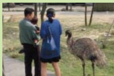
動物たちと気軽にふれあえるのも魅力。