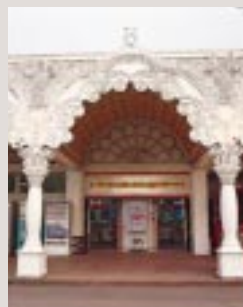
正面ゲートを入ってすぐだから、待ち合わせ場所にもグッド。