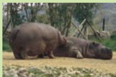
カバのお肌はとってもデリケート。乾燥を防ぐため、夏は日焼け止め、冬は食用油を体中に塗ってもらっているんだって。