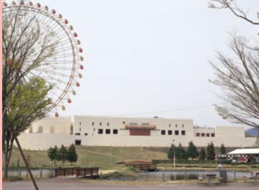
風の城エリアは、パークの丘の上にある。お城の雰囲気満点。

プレイヤーにもれなく与えられる「ラムカーナ勲章」。訓練の成果によってダイヤモンドロード、ゴールデンナイト、シルバーシーフ、ブロンズソルジャーの4つにランク付けされる。