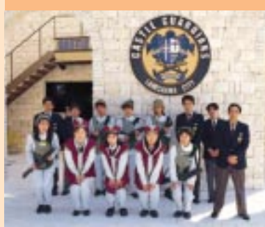
館店長(一番右)と『風の城』の警護にあたるスタッフが集合。パーク全体のガイドもオマケ!