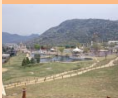
巨大の一言。姫路セントラルパークなのだ。

姫路セントラルパーク 兵庫県姫路市豊富町神谷 ☎0792-64-1611 無休 9時30分～17時30分(11月下旬～3月上旬は10時～16時30分) 入園料 サファリ・プレイゾーン共通 大人(中学生以上)2700円 / 小人(3歳～小学生)1700円 プレイゾーン 大人(中学生以上)1200円 / 小人(3歳～小学生)700円