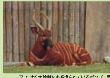
アフリカ5大珍獣にも数えられているボンゴ。栗色の毛に映える白い横縞が美しい。

アフリカの大草原さながらの開放感あふれる空間が広がる。なかでもウシ科のレイヨウ類は全部で20種。コレクションとしては世界有数を誇る。