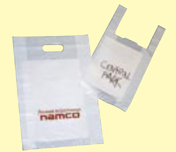
姫路セントラルパーク内の「サイバーステーションII」で見つけたオリジナルBAG。姫路の思い出をバンバンに詰め込んで帰りたいね。

ゲームの楽しさもモチロンだけど、袋にだってコダワリがあるんです。あなたは良き理解者です！